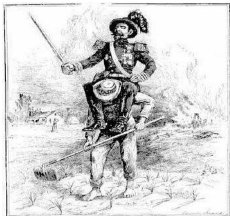
THE WHITE MAN'S BURDEN.—The Horn, Chicago.

Observa con atención la caricatura e interpreta que quiere decir el autor sobre el imperialismo. Argumenta tu respuesta